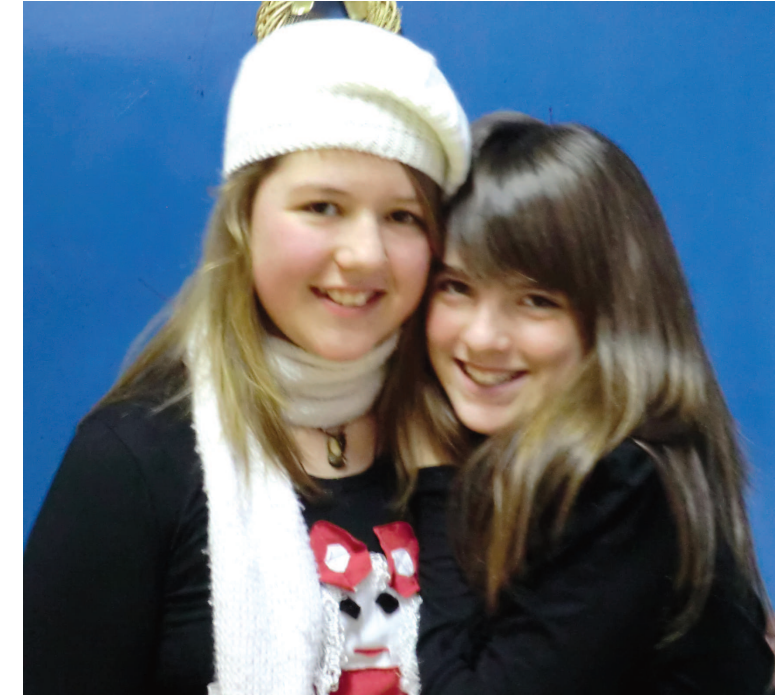
naši školski modeli

ASJA: - Sve je dobro i ja ne bih ništa promijenila.