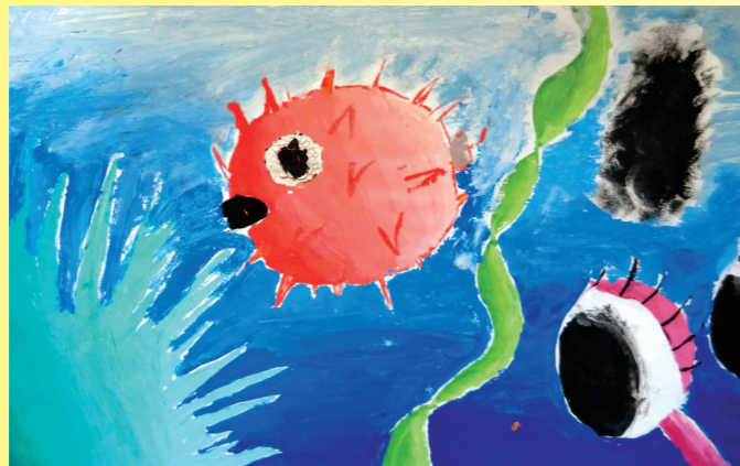
Paula Čaleta, 7. a