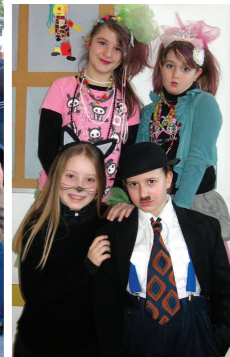
zanosni čuvari reda i discipline u društvu s jednim Vikingom, jednim vampirom, dvije prekrasne dame, poslovnim čovjekom i ženama-mačkama