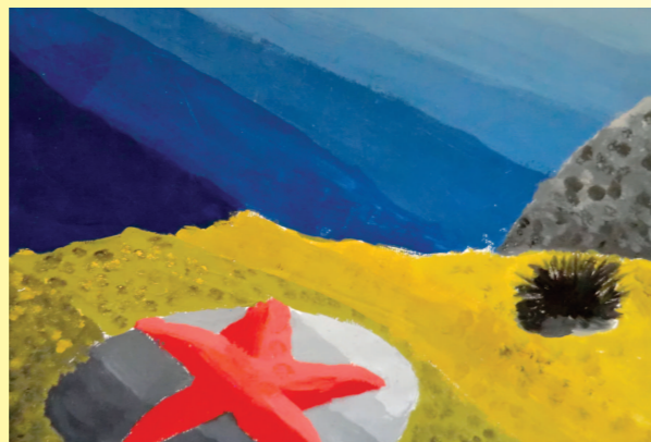
Lucija Kustić, 7. b