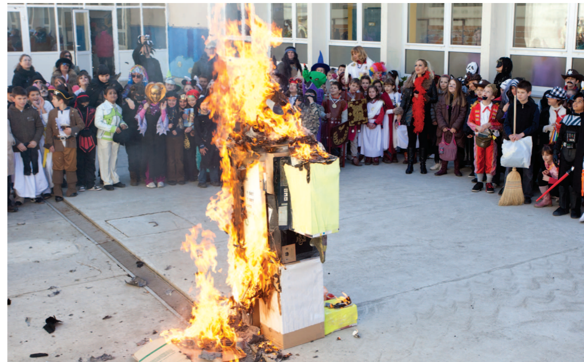
Za Krnju nije bilo milosti!

Dana 8. ožujka vesela, raspjevana i šarolika povorka maškara svečano je zapalila Krnju u dvorištu naše škole. Svi policajci, princeze, ratnici, klaunovi, vampiri, Dioklecijanovi vojnici, sam Dioklecijan i sva njegova carska svita, ljepotice i zombiji bili su jedinstveni u odluci da je opet Krnje kriv.