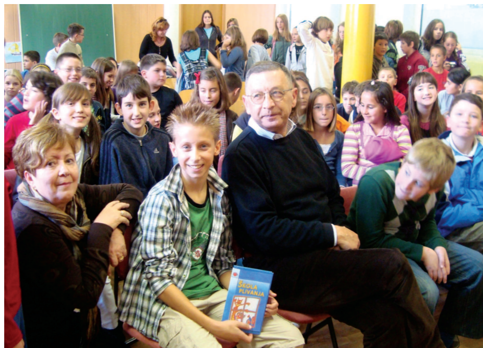
pisac i njegovi čitatelji

Drugi ovogodišnji književni susret s Matkom Marušićem zbio se 11. 12. 2011. Bilo je to radosno i vrlo zanimljivo iskustvo. Povod je bilo piščevo nazočnost u rodnom gradu Splitu, a i njegova spremnost da se u svakom trenutku rado odazove na susrete sa svojim najmlađim čitateljima. Učenici tijekom ove godine imaju i lektirni naslov Snijeg u Splitu - upravo njegovu zbirku priča - koja je divno svjedočenje o jednom djetinjstvu bitno drugačijem od našeg. Pisac Matko Marušić iznimno je jednostavan u nastupu, zanimljiv i energičan čovjek. Njegove priče iz starih splitskih kvartova baš kao i on sam, plijene pozornost od početka do kraja.