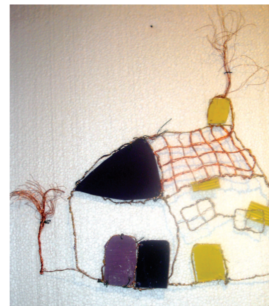
likovni rad Marije Kovač