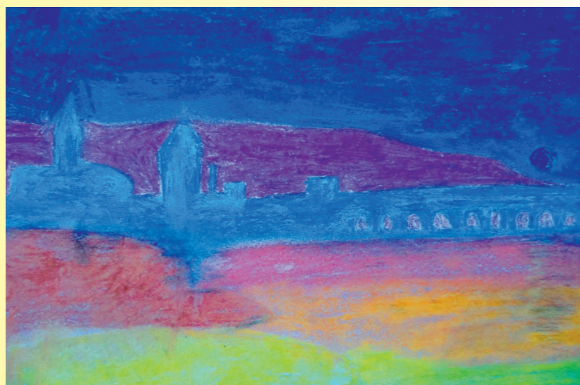
Mladen Palić, 8.b